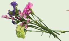
Flower bouquets no string or elastic bands