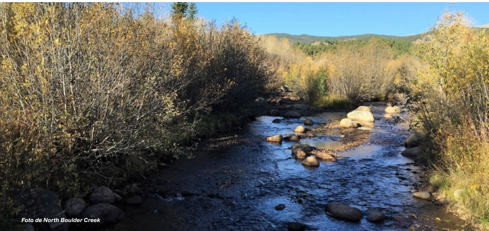
Foto de North Boulder Creek

Please share the above information with all the other people who drink this water, especially those who may not have received this notice directly (for example, people in apartments, nursing homes, schools, and businesses). You can do this by posting this notice in a public place or distributing hard copies.