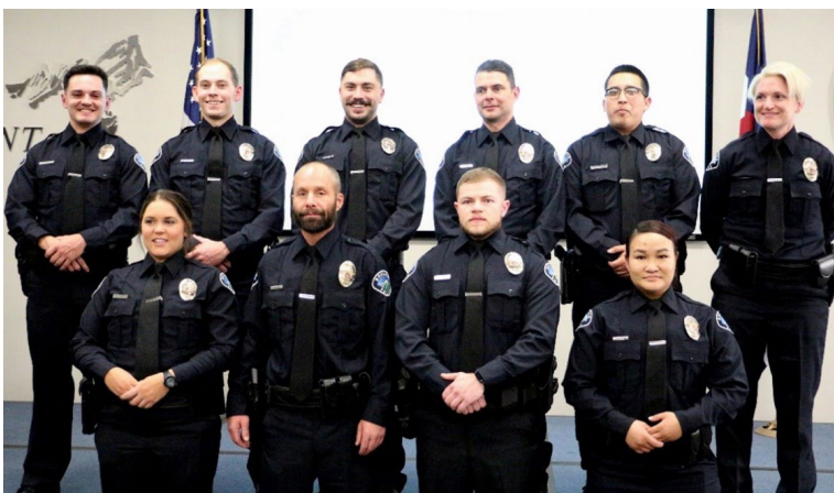
(Arriba): Nuevos oficiales juramentados en el 2021.

Las investigaciones sugieren que las mujeres policía hacen menor uso de la fuerza, aparecen en menor número denuncias, y llevan a cabo menor número arrestos discrecionales a miembros de la comunidad que no son blancos. Sin embargo, reclutar mujeres policía continúa siendo un desafío.